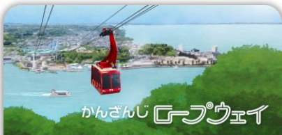
かんざんじ ケーブウェイ